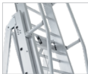
Поручни с обеих сторон лестницы