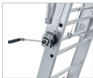
Регулировка высоты посредством внешней лебёдки

Подробнее о качестве и свойствах продукции см. в разделе сервисной информации, с. 336.