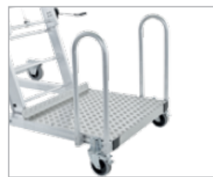
Подножка с двумя поворотными роликами