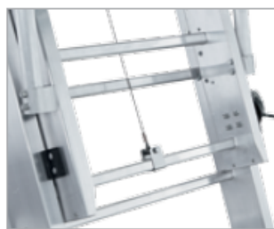
Регулировка высоты с шагом в одну ступень (280 мм)